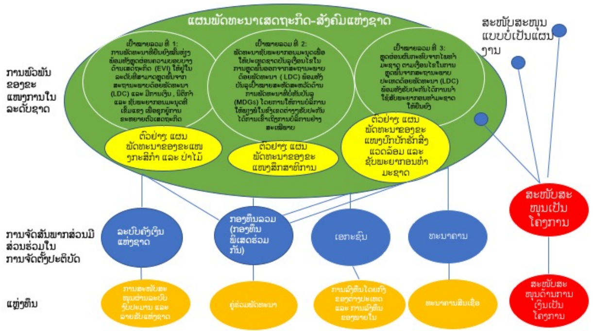
ຮູບທີ 1: ຄວາມກ່ຽວພັນລະຫວ່າງ ວ.ພ.ຜ ແລະ ແຜນພັດທະນາເສດຖະກິດ-ສັງຄົມແຫ່ງຊາດ

ການຈັດຕັ້ງປະຕິບັດໂຄງການແບບແຜນງານ ຫຼື ວ.ພ.ຜ ໃນ ສປປ ລາວ ທີ່ຜ່ານມາສ່ວນຫຼາຍແລ້ວ ແມ່ນໄດ້ອອກແບບມາເພື່ອຂະແໜງການສະເພາະ ທີ່ເປັນຮູບແບບການສະໜັບສະໜູນດ້ານການເງິນ ທີ່ມີຈຸດປະສົງເພື່ອສະໜັບສະໜູນແຜນການພັດທະນາໃນຂົງເຂດບຸລິມະສິດຂອງລັດຖະບານ ແຫ່ງ ສປປ ລາວ ເຊັ່ນ: ໂຄງການຄຸ້ມຄອງສາທາລະນະສຸກ ແລະ ວຽກງານພັດທະນາດ້ານໂພຊະນາການ, ກອງທຶນຫຼຸດຜ່ອນຄວາມທຸກຍາກ (ສະໜັບສະໜູນໂດຍທະນາຄານໂລກ), ແຜນງານຄຸ້ມຄອງສາທາລະນະສຸກ (ທະນາຄານພັດທະນາອາຊີ), ໂຄງການສົ່ງເສີມຄຸນນະພາບ ແລະ ການເຂົ້າເຖິງການສຶກສາຂັ້ນພື້ນຖານ (ລັດຖະບານອິດສະຕຣາລີ), ກອງທຶນສະໜັບສະໜູນວຽກງານເກັບກູ້ລະເບີດ (UXO) ແລະ ອື່ນໆ. ນອກຈາກນີ້ ຍັງມີການໃຫ້ການຊ່ວຍເຫຼືອແບບກອງທຶນລວມ ເຊິ່ງເປັນການຊ່ວຍເຫຼືອຫຼາຍຝ່າຍຈາກລັດຖະບານຝຣັ່ງ, ອິດສະຕຣາລີ ແລະ ສະວິດເຊີແລນ. ໂດຍລວມແລ້ວເຫັນວ່າ ສັດສ່ວນຂອງໂຄງການທີ່ເປັນແຜນງານ/ໂຄງການຊ່ວຍເຫຼືອທາງການເພື່ອການພັດທະນາທັງໝົດ ໃນປີ 2015 ແມ່ນກວມເອົາປະມານ 6% ເຊິ່ງຕົກເປັນມູນຄ່າ 654 ລ້ານໂດລາສະຫະລັດ (ຂໍ້ມູນອ້າງອີງຈາກ OECD/DAC 2015).