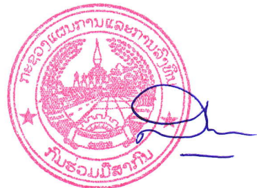
ນາງ ສິສິມບຸນ ອຸນາວິງ ຫົວໜ້າກົມຮ່ວມມືສາກົນ

ກົມຮ່ວມມືສາກົນ ມີຄວາມຍິນດີ ທີ່ຈະຕອບຄໍາຖາມຕ່າງໆ ພ້ອມທັງໃຫ້ຂໍ້ມູນທີ່ຈໍາ ເປັນກ່ຽວກັບ ບົດແນະນໍານີ້ ໂດຍຜ່ານຄະນະຮັບຜິດຊອບໂດຍກົງ ໄດ້ທີ່ ພະແນກເອີຣົບ-ອາເມລິກາ, ກົມຮ່ວມມືສາກົນ, ກະຊວງແຜນການ ແລະ ການລົງທຶນ ໂທລະສັບ: +856 021 222549. ອີແມວ: ead.dic@gmail.com.